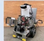
移動ロボットの制御