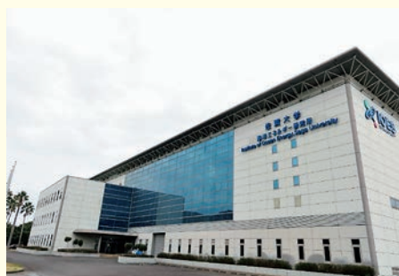
海洋エネルギー研究所伊万里サテライト