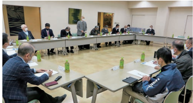
菱実会会長の挨拶