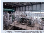
海洋温度差発電プラントの制御、遠隔監視・遠隔操作