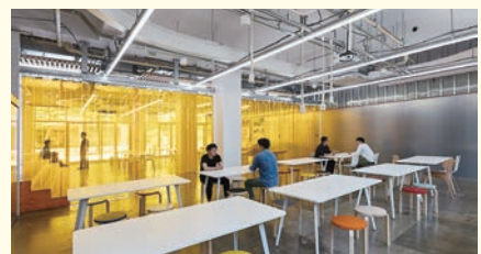
理工学部4号館1階デザインギャラリーの風景