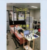
重度運動障害者のためのコミュニケーションツールの開発