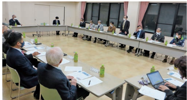
理工学部長の挨拶