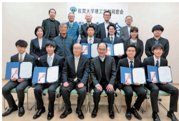
2021年度理工学部同窓会長賞受賞者と表彰式参加者全員で