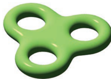
穴が3つの曲面の例 ( https://en.wikipedia.org/wiki/User:Oleg_Alexandrov/Pictures より転載)

昨年、一昨年と数理部門では部門長が寄稿していますので、研究と呼べる程のものではありませんが、私が興味を持って勉強してきたことを記します。私は0, \pm 1 , \pm 2 , …から成る整数の性質を基とする整数論と呼ばれる数学の分野を勉強してきましたが、一方では理論物理学で統一理論の候補の一つと言われる弦理論の普遍性（universality）にも強い興味を持っていました。この理論では、図のようにいくつか穴を持つ浮き輪で表される曲面どうしを識別し、その形が変わる様子を記述することが重要になります。20世紀前半のドイツの数学者タイヒミュラー（1913～1943）は、理工学系の多くの大学生が学ぶ複素関数論を基に曲面の変形を記述する理論を提唱しましたが、ナチズムを信奉して独ソ戦に従軍し、1943年のドニエプル川の戦いで戦死しました。彼が命を捧げることになったナチス・ドイツはその後崩壊しましたが、彼の理論は数学界に大きな実りをもたらすことになります。