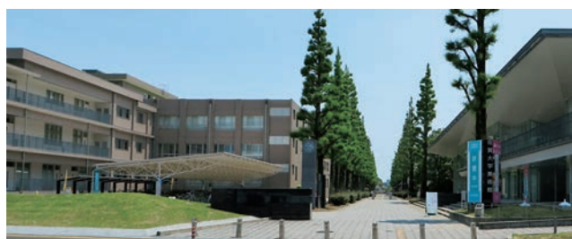
佐賀大学正門（左：教養教育2号館 右：美術館）